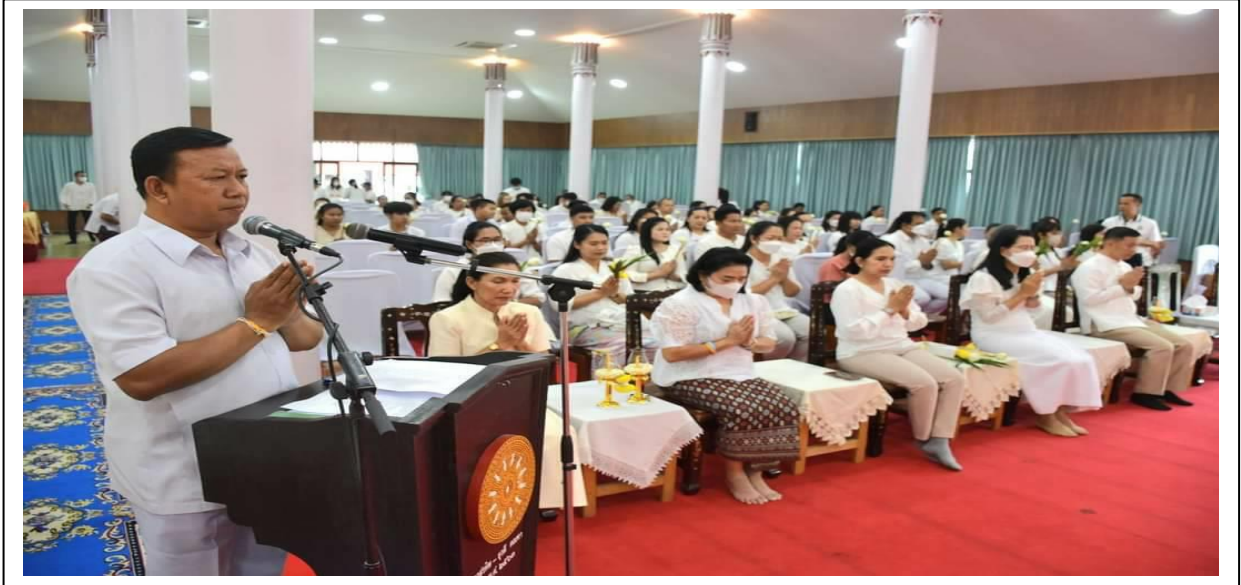
ถวายสังฆทาน

วัด อุดมธานี อำเภอ เมืองนครนายก จังหวัด นครนายก