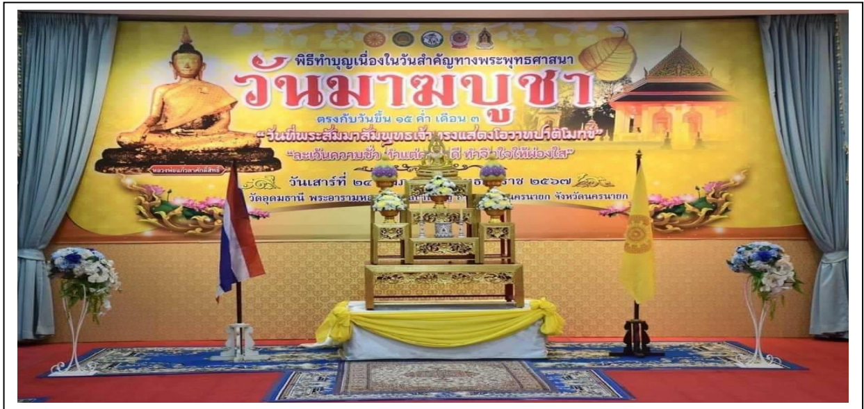
กิจกรรมวันมาฆบูชา