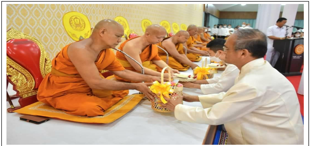
ถวายสังฆทาน