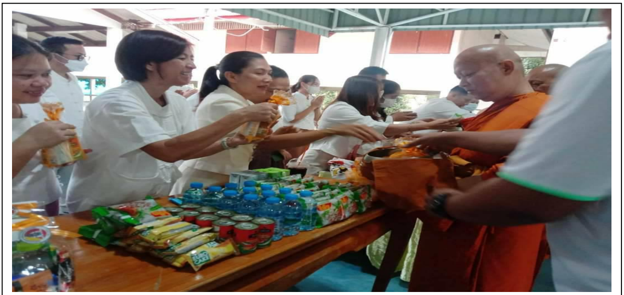
พิธีทำบุญตักบาตร