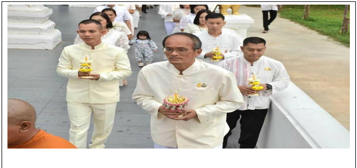
พิธีเวียนเทียน