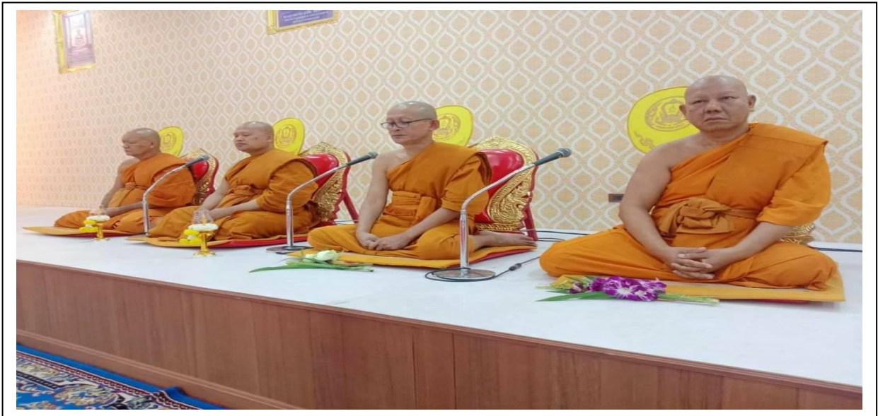
การปฏิบัติธรรมของพระสงฆ์ และคฤหัสถ์ (เจริญจิตตภาวนา)