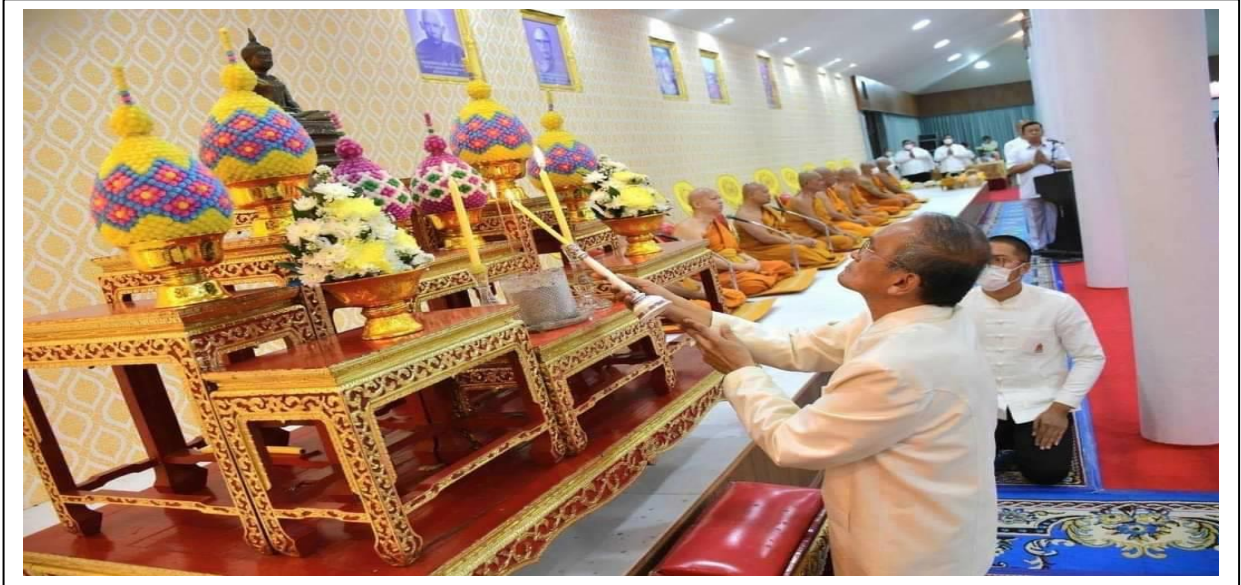
การบรรยายธรรม

วัด อุดมธานี อำเภอ เมืองนครนายก จังหวัด นครนายก