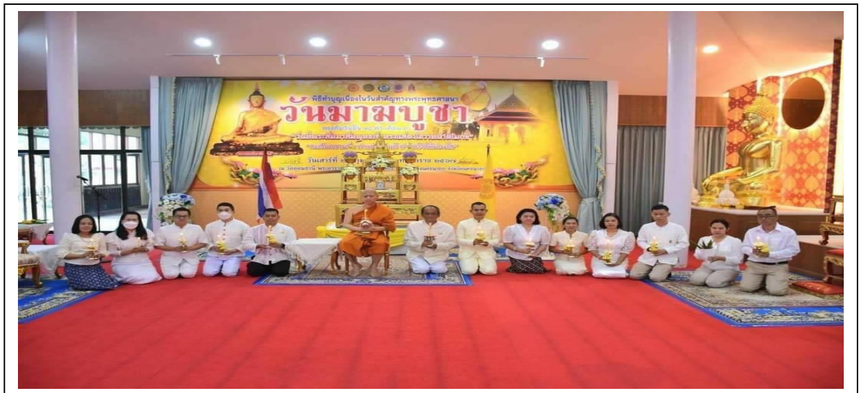
กิจกรรมวันมาฆบูชา