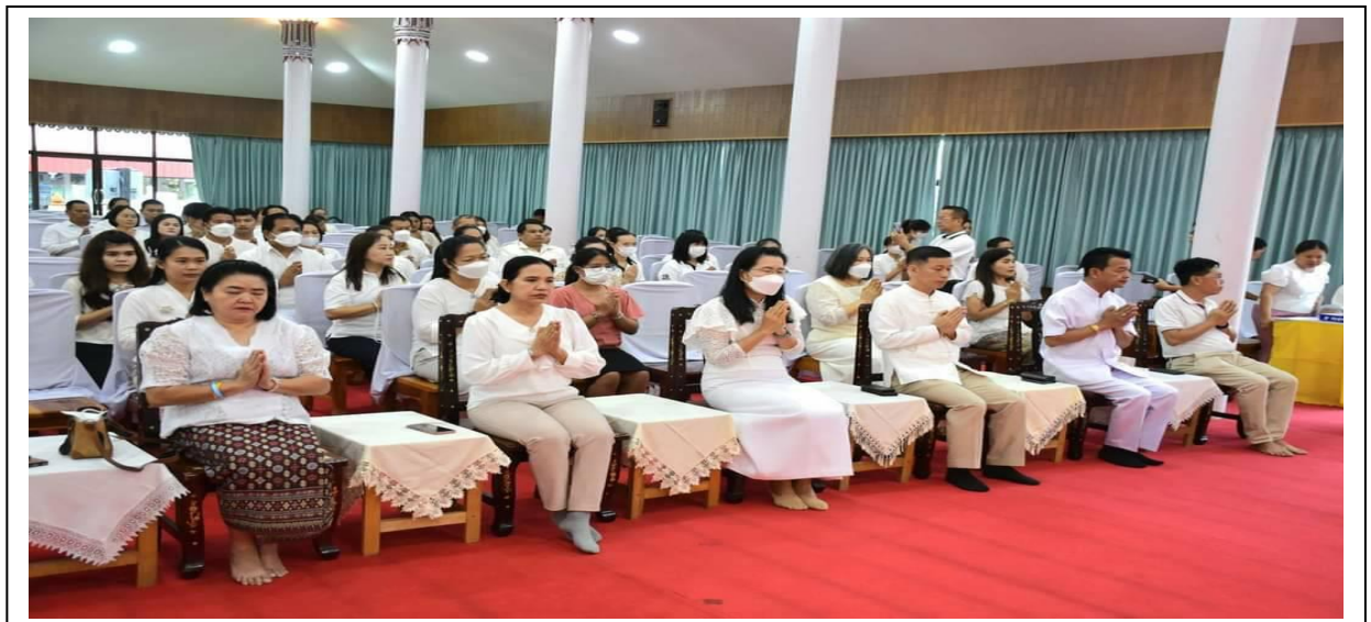
พิธีเจริญพระพุทธมนต์