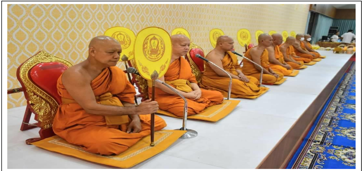
พิธีเจริญพระพุทธมนต์