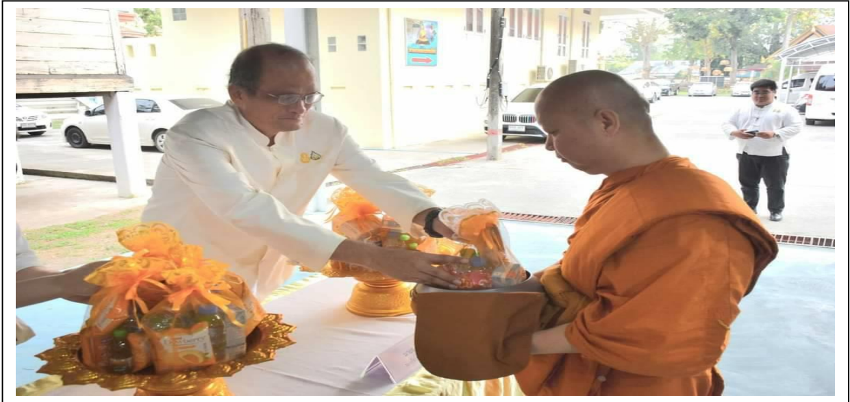
พิธีทำบุญตักบาตร