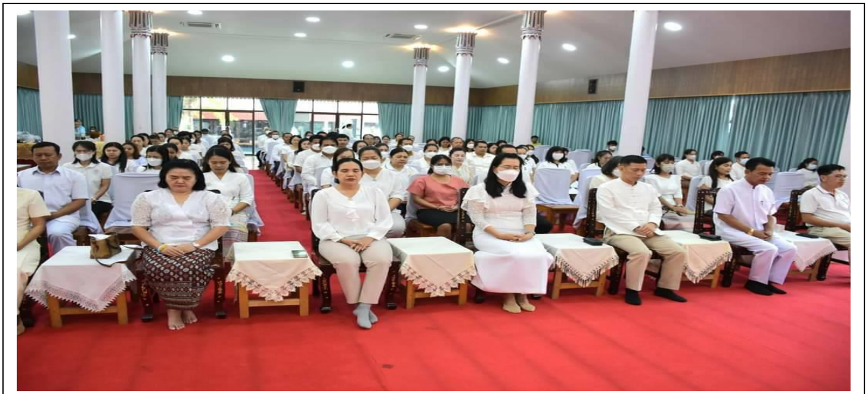
การปฏิบัติธรรมของพระสงฆ์ และคฤหัสถ์ (เจริญจิตตภาวนา)