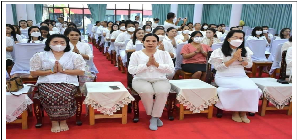
การบรรยายธรรม