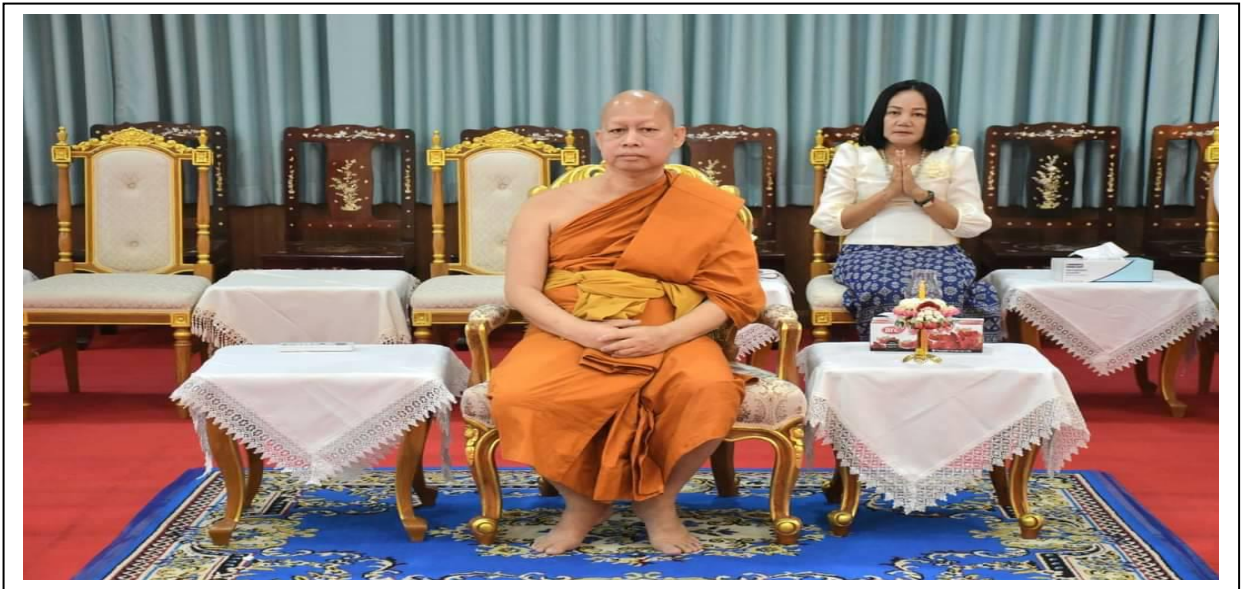
มีพระครูปริยัติโพธิสุนทร เจ้าอาวาสวัดอุดมธานี และเจ้าคณะอำเภอเมืองนครนายก เป็นประธานสงฆ์